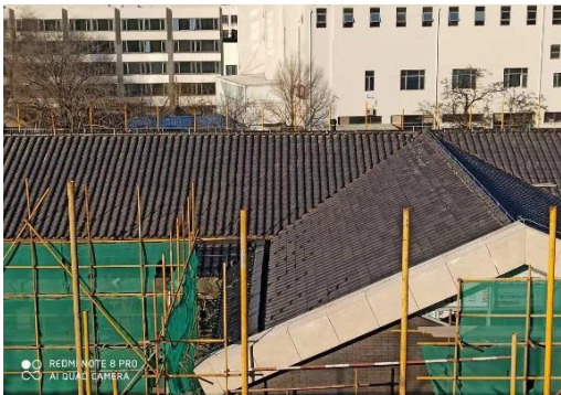
图6 国家发展研究院屋面