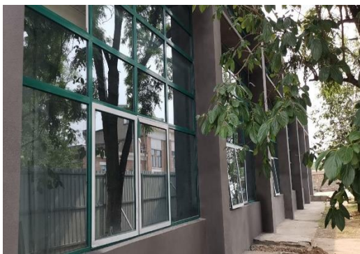
图 15 昌平园区实验动物临建设施铝合金窗户施工