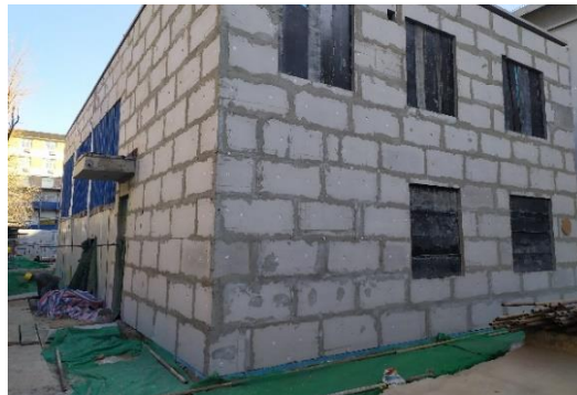
图9 密闭式清洁站外墙保温完成