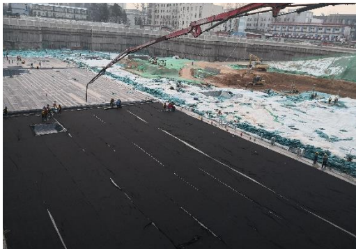
图8 工学院与交叉学科大楼2号楼防水保护层施工