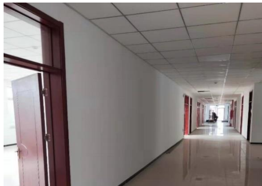
图 16 昌平南平房改造工程室内