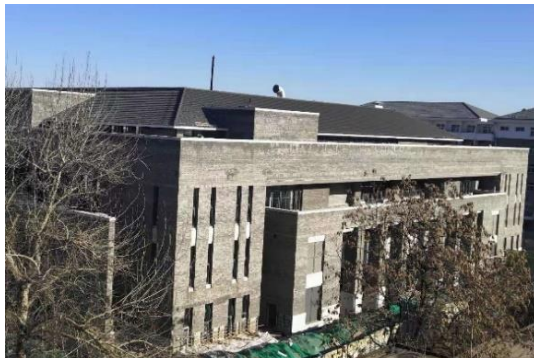
图7 餐饮综合楼外檐