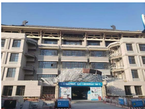
图11 图书馆东楼修缮改造外立面