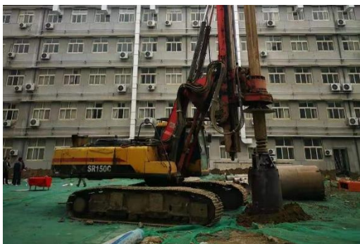
图10 化学学院E区大楼旋挖桩机开始进场