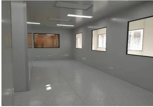
图3 化学院D区一层器件加工测试平台装修工程