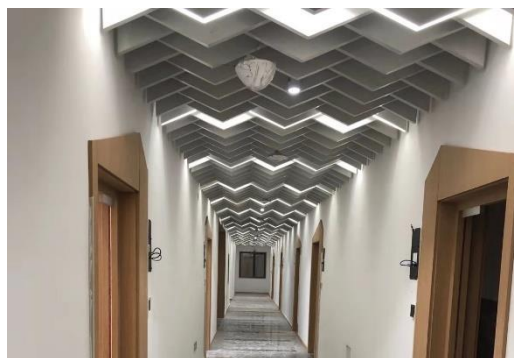
图 14 35楼地下室装修工程吊顶施工