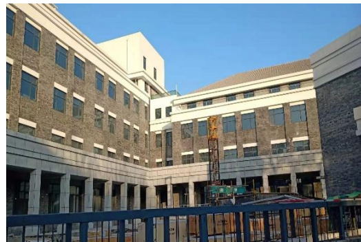
图5 实验设备2号楼外墙