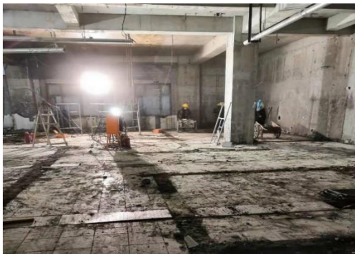
图 13 成府园食堂装修工程地下二层拆除施工