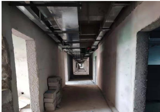
图4 城环景观设计学大楼室内