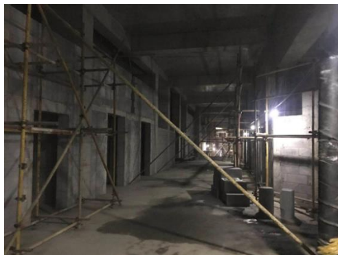
图5 国家发展研究院室内二次结构施工