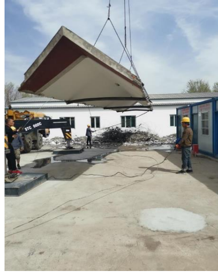
图 12 昌平园区实验动物临建设施改造屋面挑顶施工

5.外文楼及民主楼修缮：完成民主楼屋面、外檐油漆彩画，外文楼进行油漆彩画及室内装修。