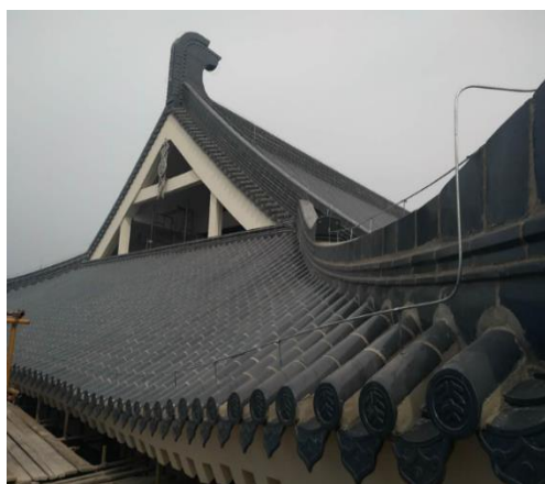
图9 图书馆东楼修缮改造屋面瓦施工

2. 太平洋大厦外立面改造：北、西、南立面基本完成陶板施工，东西面完成保温施工。