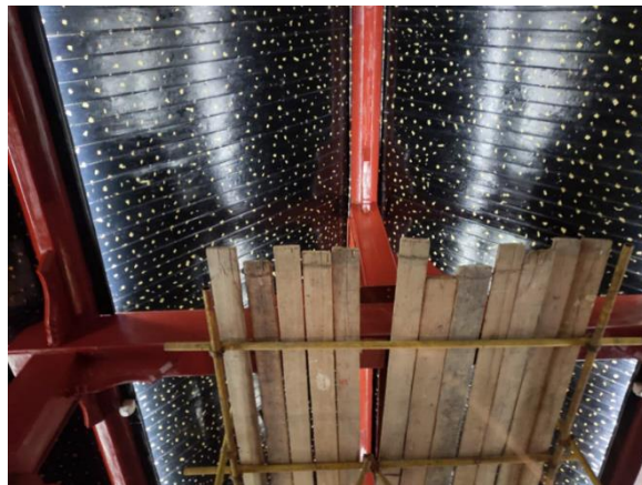
图 13 外文楼及民主楼修缮正在进行室内装修

5.外文楼及民主楼修缮：完成民主楼屋面、外檐油漆彩画，外文楼进行油漆彩画及室内装修。