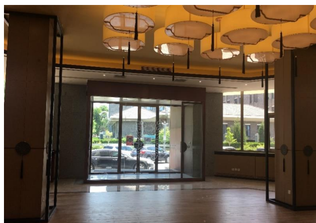
图2 勺园零点餐厅及自助餐厅装修工程