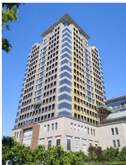
图10 太平洋大厦南立面完成陶板安装，正在收口。