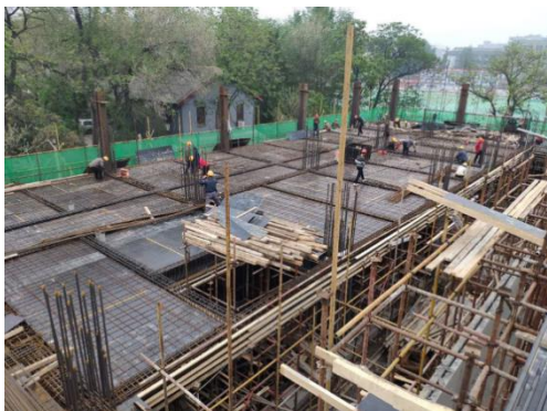
图4 景观设计学大楼 II 段主体结构施工