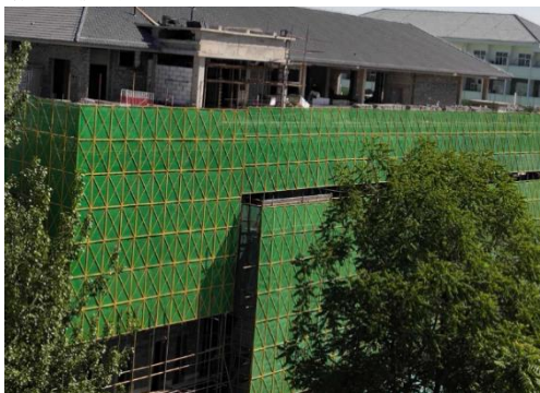
图6 餐饮综合楼屋面工程施工