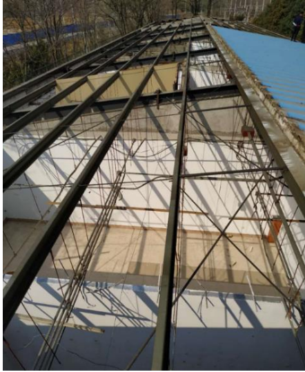
图 11 昌平南平房改造屋架施工中