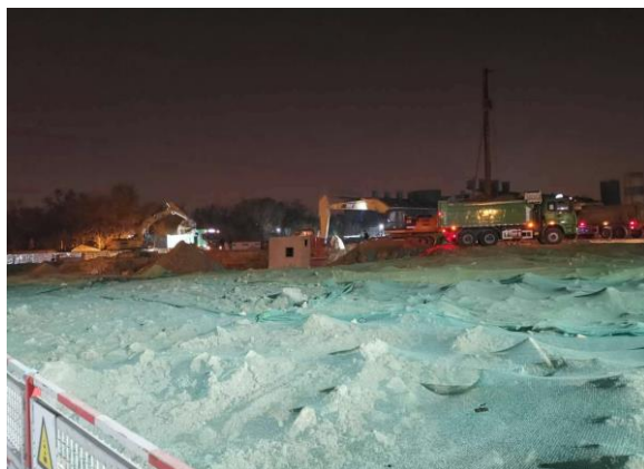
图8 工学院与交叉学科大楼2号楼进行土方开挖