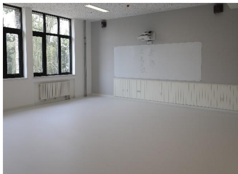
图7 附中北校区综合教学楼内装修完成