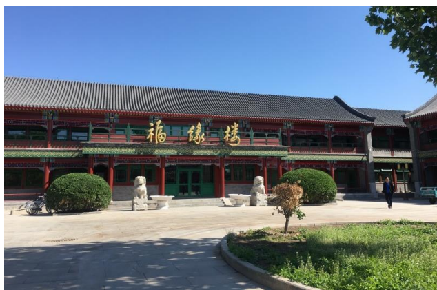
图1 光华管理学院达园宾馆福缘楼装修改造工程

新竣工交付使用的工程有 3 项,分别是光华管理学院达园宾馆福缘楼装修改造、勺园零点餐厅及自助餐厅装修、45乙楼地下室改造工程。