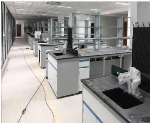
图 11 生命科学实验室改造工程首层实验台安装完成

1. 生命科学实验室改造:机电设备安装完成约 80%,各特殊实验室完成约 80%。