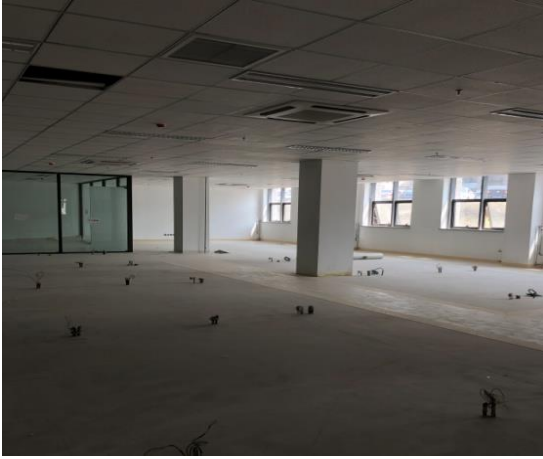
图 9 生命科学科研大楼地下一层 PVC 施工