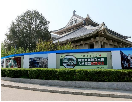
图 13 图书馆东馆修缮改造工程中国梦宣传画室外围挡

4. 百周年纪念讲堂多功能装修改造：已进场施工，作业脚手架搭设完成，正在进行钢架安装施工。