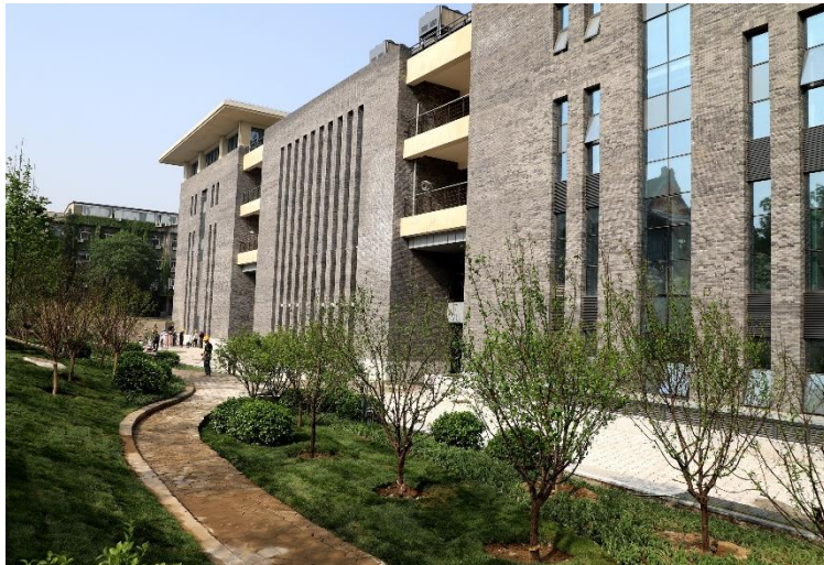
图5 生命科学科研大楼室外景观工程