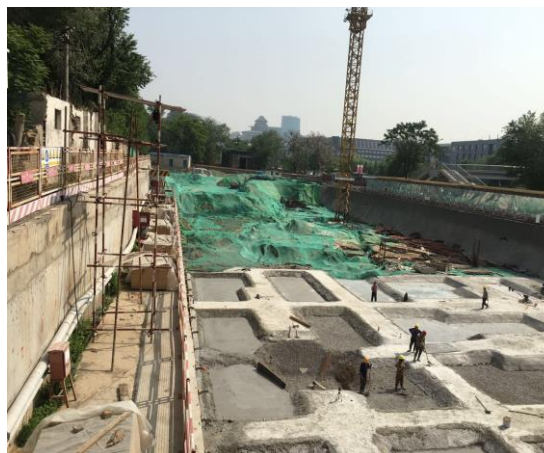
图7 景观设计学大楼II段基础垫层施工