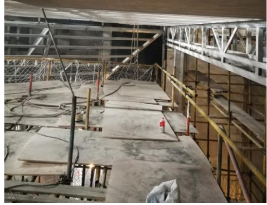
图 14 百周年纪念讲堂多功能装修改造工程钢架安装

4. 百周年纪念讲堂多功能装修改造：已进场施工，作业脚手架搭设完成，正在进行钢架安装施工。