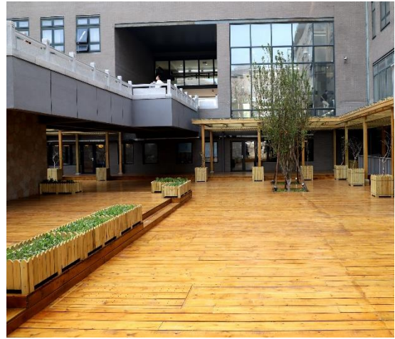
图4 二教下沉庭院工程