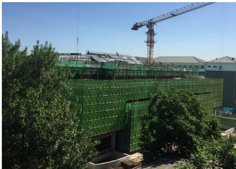
图8 餐饮综合楼工程结构封顶