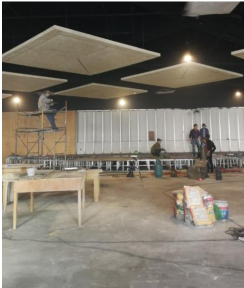
图 15 新太阳 91 剧场装修工程室内装修

5. 新太阳 91 剧场装修：室内装修中。 6. 加速器大楼改造：管线预埋、水泵房基础开挖。