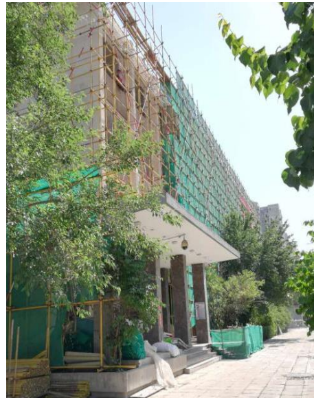
图 16 加速器大楼改造外立面