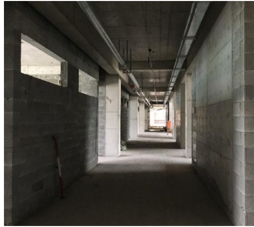
图 10 北大附中北校区综合教学楼二次结构砌筑