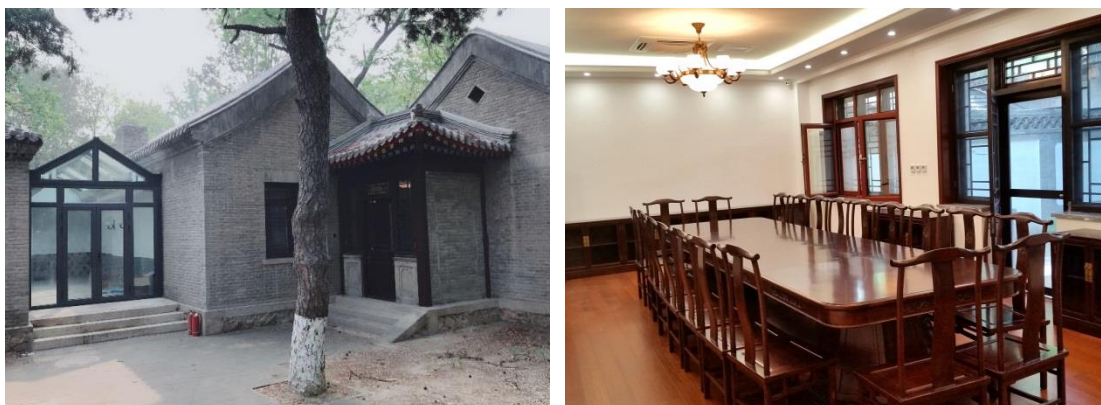
图1 燕南园57号院修缮改造工程

新竣工交付使用的工程有5项，分别是燕南园57号院修缮改造工程、校史馆装修改造工程、校景亭长廊等古建维修工程、二教下沉庭院工程、生命科学科研大楼室外景观工程。