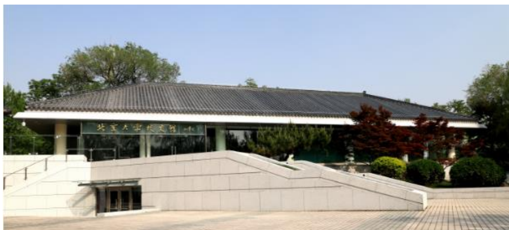
图2 校史馆装修改造工程