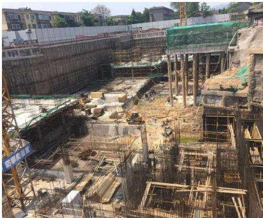
图6 国家发展研究院地下室结构施工