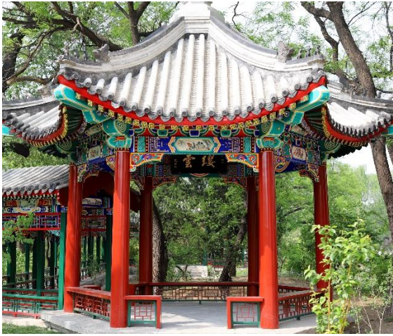
图3 校景亭长廊等古建维修工程